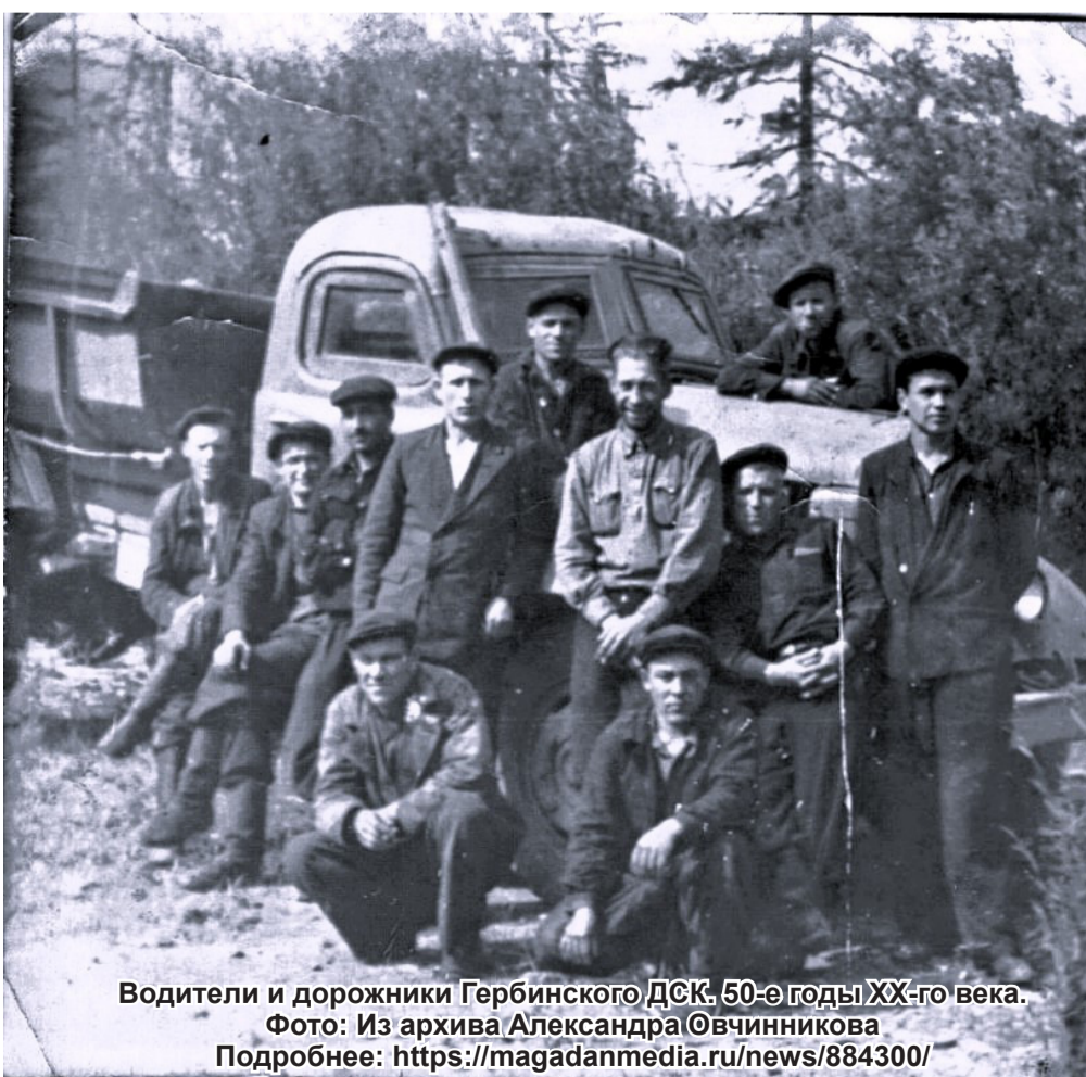
Водители и дорожники Гербинского ДСК. 50-е годы XX-го века. Фото: Из архива Александра Обвинникова Подробнее: https://magadanmedia.ru/news/884300/

4 января 1957 года решением Магаданского облисполкома № 3 в составе Омсукчанского района был образован Буркотский сельский Совет с центром в посёлке Буркот. В поселке были почта, клуб, фельдшерский пункт, баня, столовая и другие объекты соцкультбыта.