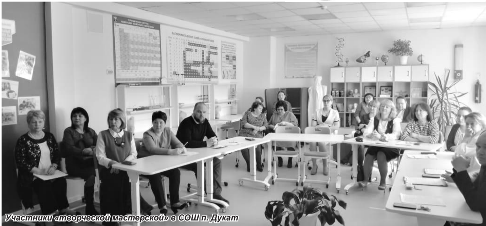
Участники «творческой мастерской» в СОШ п. Дукат