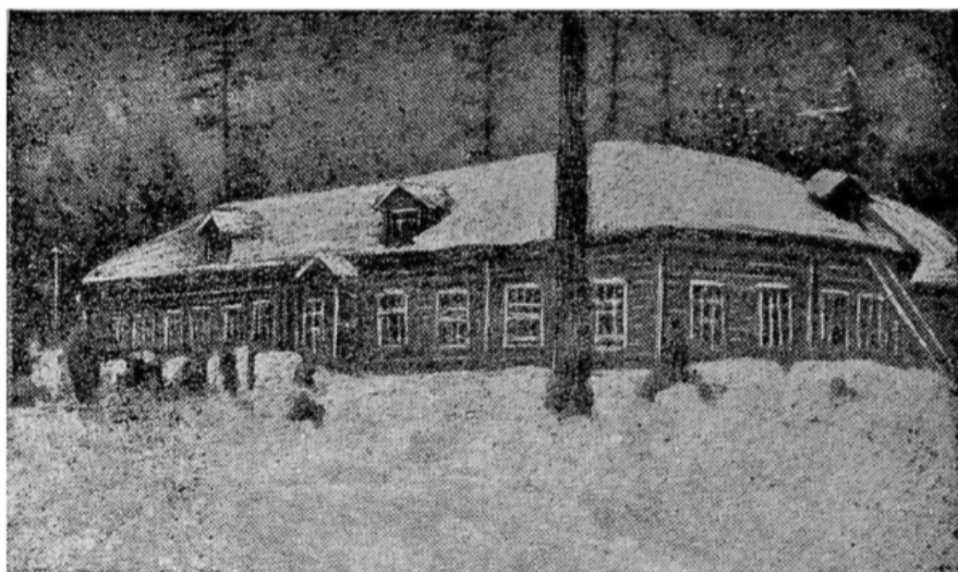
Школа в поселке Меренга, в верховьях реки Вилига. 1939 год. Фото из газеты «Советская Колыма»

За десяток лет пришла в упадок и трасса, строительство которой в 1941 году потребовало столько жизней.