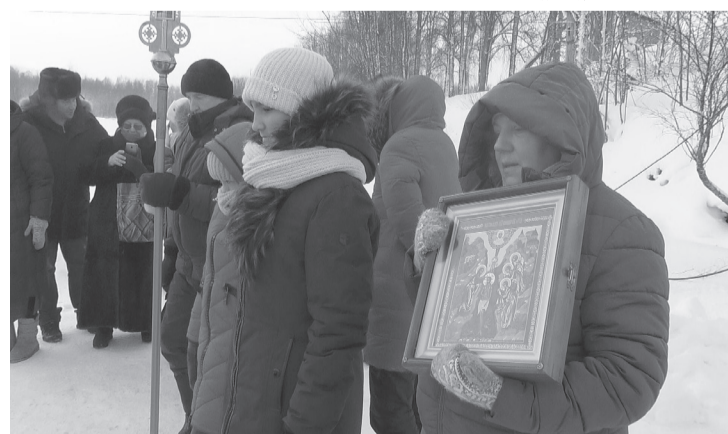
Крещение вода приобретает целебные свойства и очищает человека от грехов.