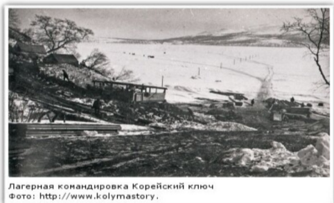
Лагерная командировка Корейский ключ

Корейский ключ впадает в бухту Нагаева примерно в двух километрах далее современного морского порта. В начале — середине 1930-х годов в районе лагкомандировки Корейский ключ находились лесозаготовки, лес с которых использовался при строительстве портовых сооружений и пирсовых рьяжей.