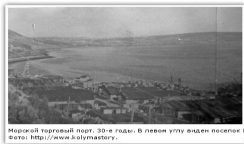
Морской торговый порт. 30-е годы. В левом углу виден поселок Березовый мыс.

Автобусная остановка «Бермыс» находилась между остановками «Каменный карьер» и «Морпорт» (автобус до морпорта ходил тогда) четыре раза в сутки), из чего можно сделать вывод, что и сам поселок Березовый мыс располагался между поселками Березовая роща и Каменный карьер, на расстоянии примерно 1–2 километров от морского порта того времени в сторону города. Сегодня необходимо учитывать, что с тех пор морской торговый порт существенно расширился и его территория стала ближе к городу.