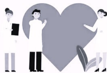
Пройдите диспансеризацию – бесплатное комплексное медицинское обследование по ОМС.

II ЭТАП диспансеризации проводится при наличии показаний по назначению терапевта и включает в себя консультации врачей-